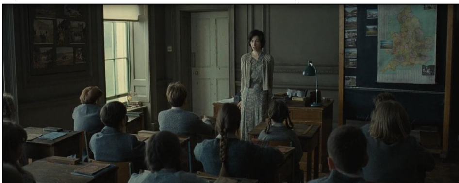
Figura 01 A nova tutora contando o futuro dos jovens

Fonte: Cena do filme Nã me abandone jamais