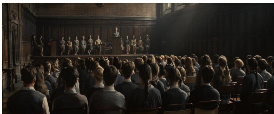
Figura 6: A diretora do orfanato passando algumas normas