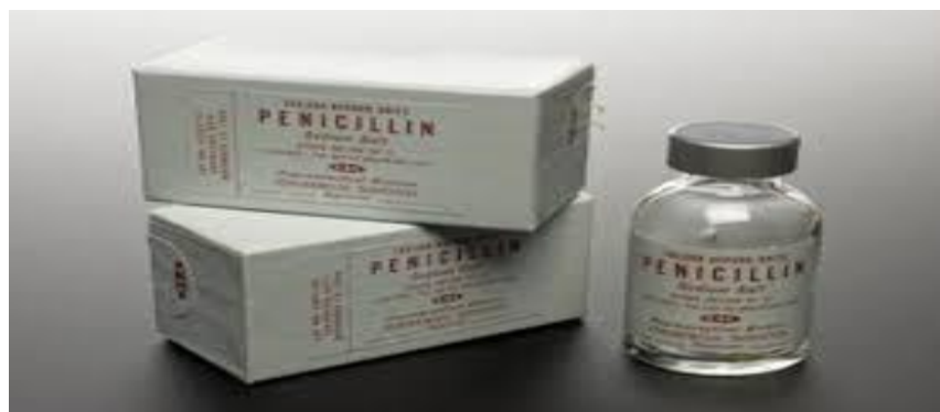
Figura 07: Penicilina (antibiótico)

América, sendo assim Rocha 17 trás uma fragmentação da medicina o que resultou em cura de doenças até então dadas como sem cura. Essa revolução na medicina contribuiu para que os conhecimentos avançassem e desenvolvessem novas técnicas mais eficientes, com exames mais sofisticados, diagnósticos eficaz . Como o mostrado na figura 07.