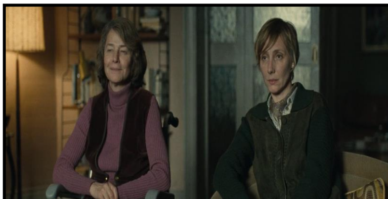
Figura 03: Antigas diretoras do internato de Hailsham

Figura 03: Antigas diretoras do internato de Hailsha