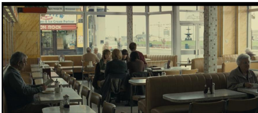
Figura 05 Os jovens no restaurante