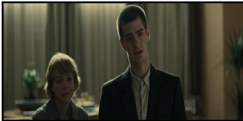
Figura 02: Tommy e Kathy